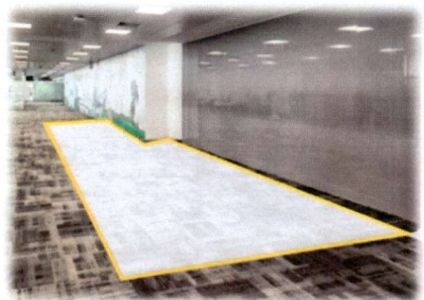
รูปภาพที่ 2

มติที่ประชุม รับทราบ และ ผทอ.ทตม.ดำเนินการในส่วนที่เกี่ยวข้องต่อไป